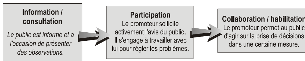
Figure 3-2 : Échelle de consultation du public.

Les deux premiers niveaux de participation s'appliquent à la plupart des ÉE, les promoteurs hésitant à ouvrir le processus décisionnel aux autres parties. Le partage du pouvoir décisionnel conviendra peut-être davantage aux projets communautaires qui, en demandant éventuellement l'appui financier du gouvernement, pourront nécessiter une ÉE.