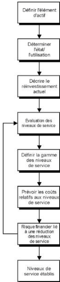
Figure 3-2 : Élaboration de niveaux de service

L'élaboration de niveaux de service comprend huit étapes fondamentales. Comme le montre la figure 3-2, le processus a tendance à être itératif. Le niveau d'effort déployé pour chaque activité risque de varier considérablement dans le cas des municipalités ou des organisations dont les données démographiques sont différentes et dans celui des types d'actif différents. Le processus lié à l'élaboration de niveaux de service relatifs à des réseaux de transport peut être très différent de celui relatif à une station d'épuration des eaux usées. Les activités de base mentionnées dans la figure 3-2 demeurent toutefois un bon processus à suivre.