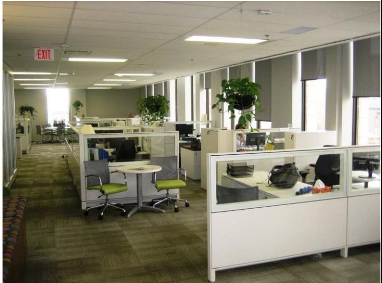
Bureaux de la FCM au 10, rue Rideau.

Avant que la FCM n'emménage dans ses nouveaux locaux d'une superficie de 121 mètres carrés (1 300 pieds carrés) – situés dans un bâtiment historique du centre-ville d'Ottawa – les membres de l'Équipe verte ont fourni des indications au sujet de l'aménagement et transmis les questions et les préoccupations du personnel au Comité de la FCM responsable des bâtiments.