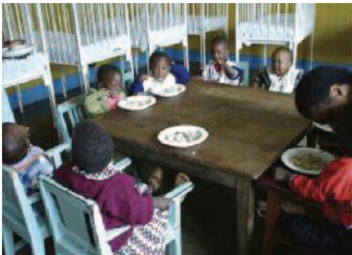
De jeunes enfants partagent un repas à l'orphelinat de Lushoto.