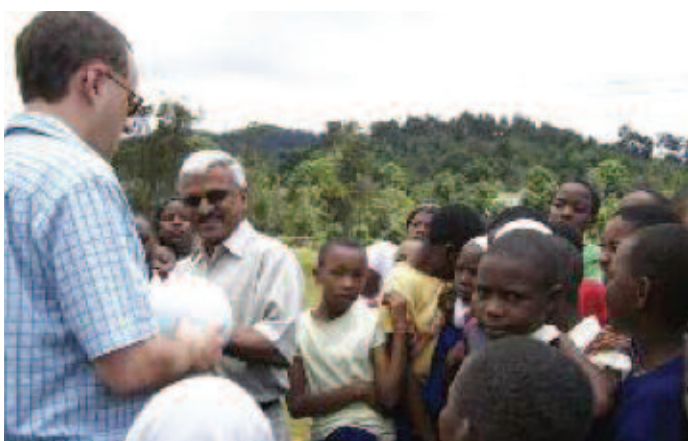
L'équipe de Drayton Valley rencontre des enfants à Lushoto. Les nombreux dons offerts par la collectivité de Drayton Valley à celle de Lushoto comprenaient des ballons de soccer.