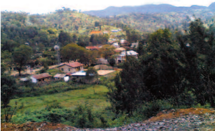
Le district de Lushoto de la région de Tanga, en Tanzanie.

Le conseil municipal du district de Lushoto – l’une des régions les plus pauvres de Tanzanie – avait besoin d’augmenter la base de ses revenus de manière à fournir des services à ses citoyens. Lushoto devait aussi prendre soin d’une population orpheline grandissante, principalement à cause de l’épidémie du sida.