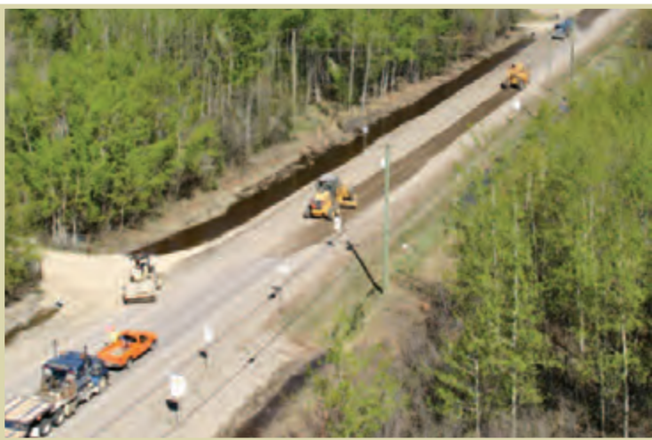
Construction d'une route rurale au nord-est de la Colombie-Britannique.

Le partage des recettes de ce type implique que le gouvernement provincial établisse l'assiette fiscale, fixe le taux d'imposition et perçoive l'impôt, et qu'il distribue une portion des recettes aux municipalités sur une base par habitant. Ce type de partage des recettes revient au même qu'un transfert à l'exception près que les recettes municipales dépendent de la perception des impôts par le gouvernement provincial. Le principal avantage de cette option (à l'instar du partage des recettes de la taxe fédérale sur l'essence décrit précédemment) est que les recettes fournies aux municipalités sont prévisibles parce qu'elles augmentent automatiquement au fur et à mesure de l'augmentation des recettes provinciales provenant de ces impôts. Pour offrir une source stable de recettes aux municipalités, le gouvernement provincial doit maintenir le pourcentage des recettes qui leur revient au fil du temps. Comme pour le partage de la taxe fédérale sur l'essence, les fonds ne sont pas nécessairement attribués là où ils sont le plus nécessaires, mais à la différence du partage des recettes de la taxe fédérale sur l'essence, les municipalités ont conservé toute discrétion sur la manière dont les fonds sont dépensés puisque le transfert est, en grande partie, inconditionnel.