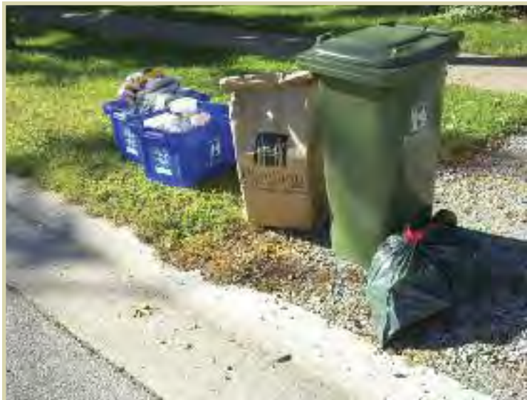
DANIEL BANNOVILLE DE HAMILTON, ONTARIO

La FCM a soutenu le projet pilote de collecte et de réacheminement des ordures ménagères à trois flux de la Ville de Hamilton par une subvention de 100 000 $ du FMV.