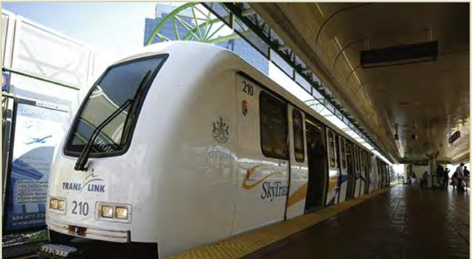
La FCM a aidé la Ville de Burnaby, en Colombie-Britannique, à réaliser l'étude du stationnement à proximité des gares en lui octroyant une subvention du FMV de 30 000 $.

Pour atteindre cet objectif, la FCM emploie trois fonctions intégrées de collaboration : recherche, renforcement des capacités et communications. La FCM réalise des recherches reliées aux secteurs